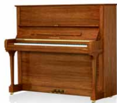
Отделка корпуса: орех