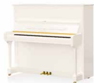
Отделка корпуса: белое полированное