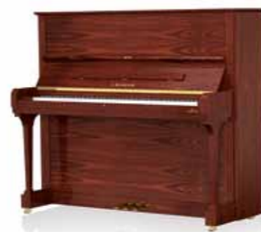
Отделка корпуса: красное дерево