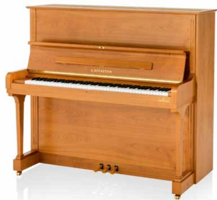
Concert 8. Отделка корпуса: вишня

Представляем вашему вниманию некоторые варианты отделки корпуса. Будем рады воплотить в жизнь ваши представления об идеальном пианино. Компания «К. Бехштейн» специализируется на изготовлении уникальных инструментов по индивидуальным заказам.